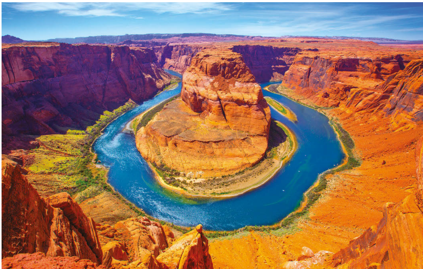
▲ Horseshoe Bend, méandre du Colorado en aval du barrage de Glen Canyon (Arizona).

métaphores qui rendent présent le champ lexical de l'eau malgré la rareté de cet « or bleu » : Atlanpolis est urbanisée en cercles concentriques (« une ville qui perpétue la symbolique des ronds dans l'eau », p. 12) ; Bruce prend un « ascenseur-bulle qui gliss[e] telle une goutte d'eau tout au long du flanc de la tour centrale » (p. 17) ; il « plonge » dans les mines avec son vaisseau comparé à un piranha ; la Villa Blanche est « noyée dans des jardins fleuris et on sen[t] des parfums flotter dans l'air » (p. 96). Le roman est donc comparable à la Grotte Bleue puisque, dans les deux cas, on pense que l'eau est absente alors qu'elle est seulement cachée.