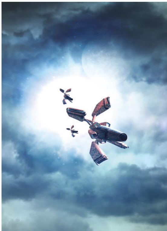
▲ Dessin d'un vaisseau spatial dans les nuages.