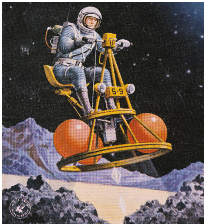
▲ Scooter piloté par un astronaute en scaphandre, illustration d'Alex Shomburg pour Rider in the Sky de Raymond F. Jones in Amazing Stories , 1964.

7. Bruce fait penser à Héraclès qui, alors qu'il n'est encore qu'un bébé, étrangle sans difficulté les serpents envoyés par Héra pour le tuer. Il fait aussi penser à Icare, le fils de Dédale, qui parvient à s'enfuir du labyrinthe par les airs, avec des ailes collées par de la cire. Grisé par le plaisir de voler, il oublie la prudence et ne suit pas les conseils de son père : en s'approchant trop près du soleil, ses ailes se détachent et il meurt en tombant à la mer.