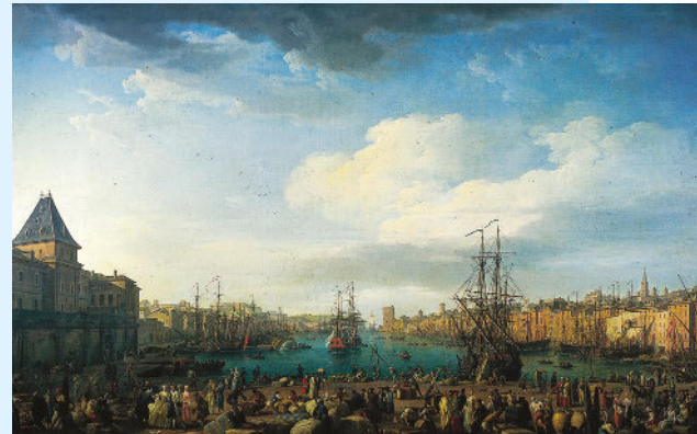
▲ Joseph Vernet, Le port de Marseille , peinture, 1754-1756, musée du Louvre, Paris.

Joseph Vernet, né en 1714, a été formé dans l'atelier de son père, lui-même peintre, avant d'obtenir en 1734 une bourse pour étudier à Rome et s'y installer. Le jeune homme est talentueux : il acquiert une manière de peindre lumineuse et colorée, un art de camper de façon réaliste et vivante ses personnages, et satisfait les goûts de son époque en peignant des paysages et, surtout, des scènes de naufrages que les amateurs de l'époque, curieux de tout ce qui concerne la nature et cette science nouvelle qu'est la météorologie, apprécient particulièrement. Il peint le plus souvent sur le motif : la légende veut qu'il se soit fait attacher à un mât pour mieux étudier les effets de l'orage sur la mer. En quelques années, sa réputation de peintre « atmosphérique » est ainsi faite. C'est alors qu'il rencontre, toujours à Rome, le marquis de Marigny, frère de Mme de Pompadour, directeur des Bâtiments du Roi. Séduit, celui-ci propose à Louis XV de lui commander une grande série sur les ports de France, qui exaltera la richesse commerciale du pays. C'est une première ! Sur les vingt-quatre tableaux ainsi commandés en 1753 à Joseph Vernet, quinze seulement verront le jour. Leur exécution lui prendra dix ans, pendant lesquels il voyagera de port en port avec sa famille selon un plan très précis établi par Marigny.