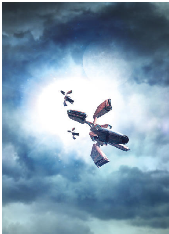
▲ Dessin d'un vaisseau spatial dans les nuages.

Par Amélie Berthou-Sergeant, professeur de lettres modernes au collège Jean Jaurès (Clichy-la-Garenne)